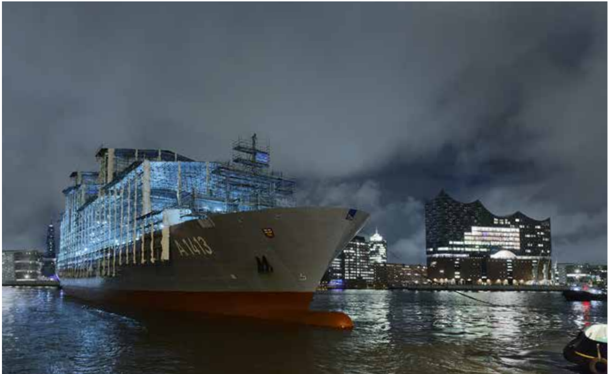
Einsatzgruppenversorger „Berlin“ der Bundesmarine, Hamburg