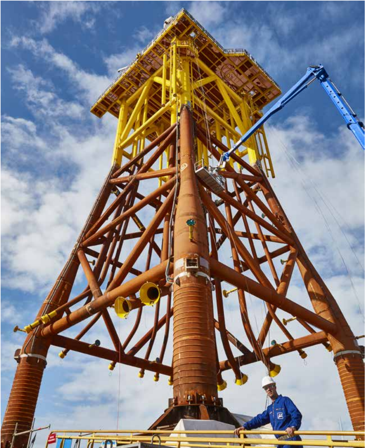
Jacket-Konstruktion für Offshore-Windkraftanlagen in Saint-Nazaire/Frankreich