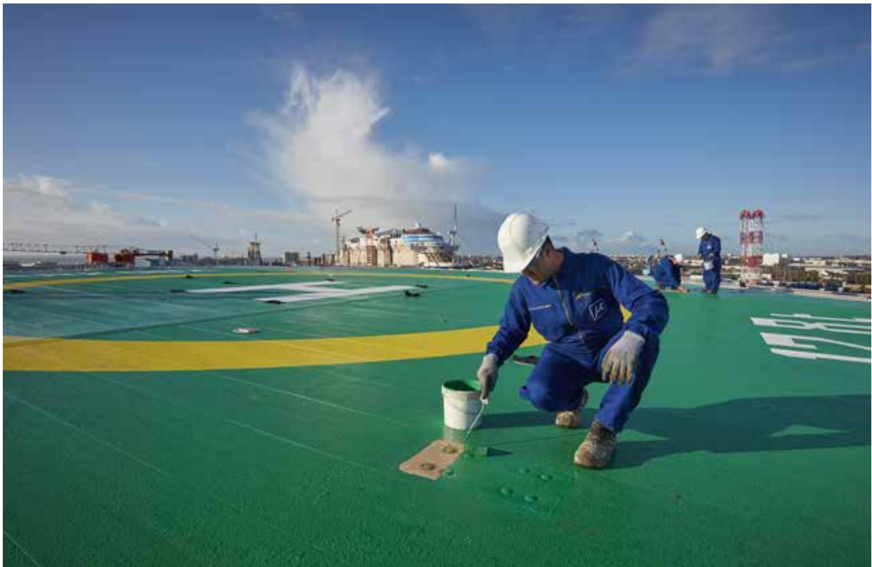
Aufbringung von Oberflächenschutz an Offshore-Transformerplattform in Saint-Nazaire/Frankreich

Wesentliche Änderungen der Chancen und Risiken im Vergleich zum Geschäftsjahr 2017 liegen nicht vor. Wir verweisen deshalb auf die ausführlichen Erläuterungen im Geschäftsbericht 2017.