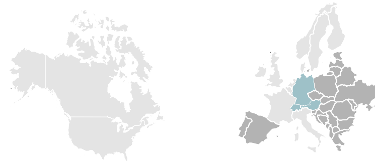
Marktzugang zu institutionellen Investoren | Kernmärkte