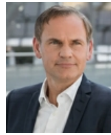
Dr. Oliver Blume Vorsitzender