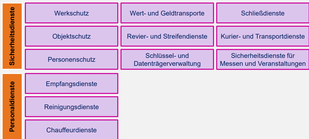
ABBILDUNG 1: DIENSTLEISTUNGEN VON SDM