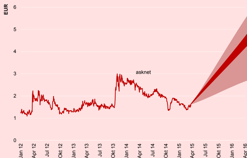
ABBILDUNG 2: KURSENTWICKLUNG UND –PROGNOSE

Auf Sicht von zwölf Monaten sehen wir ein Kursziel von EUR 4,50 je Aktie. Voraussetzung ist die Erreichung unserer Ergebnisprognosen. In unserem Bear Case-Szenario haben wir eine Intensivierung der Wettbewerbsintensität unterstellt. In unserem Bull Case-Szenario gelingt die Neukundengewinnung noch schneller.