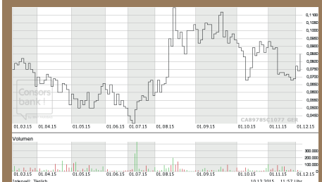
▲ Chart Deutschland (XETRA)