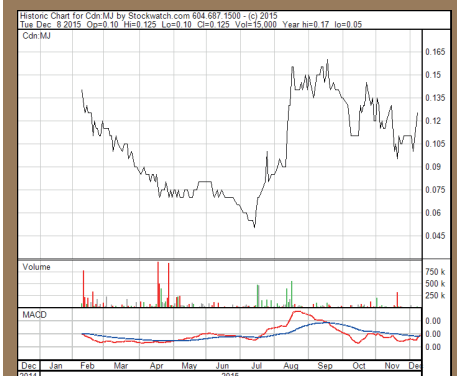
▲ Chart Kanada (CSE)