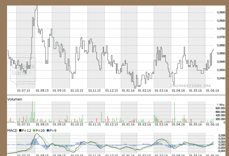
Chart Deutschland (Frankfurt)