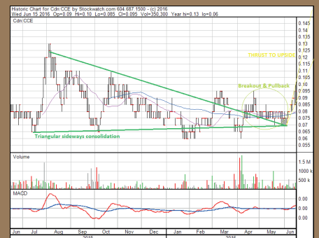
Chart Kanada (TSX.V)