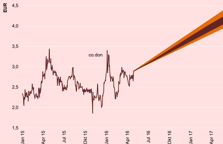
ABBILDUNG 1: KURSENTWICKLUNG UND -PROGNOSE

Auf mittelfristige Sicht sehen wir ein Kursziel von EUR 4,00 je Aktie. Voraussetzung ist die Erreichung unserer Ergebnisprognosen. In unserem Bear-Case-Szenario (EUR 3,80) haben wir eine Intensivierung der Wettbewerbsintensität unterstellt. In unserem Bull-Case-Szenario (EUR 4,20) gelingen Unternehmenswachstum und die Margenausweitung noch schneller.