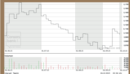
Chart Deutschland ( XETRA )