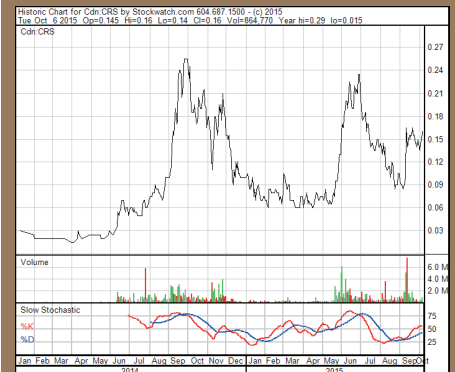
Chart Kanada ( TSX.V )