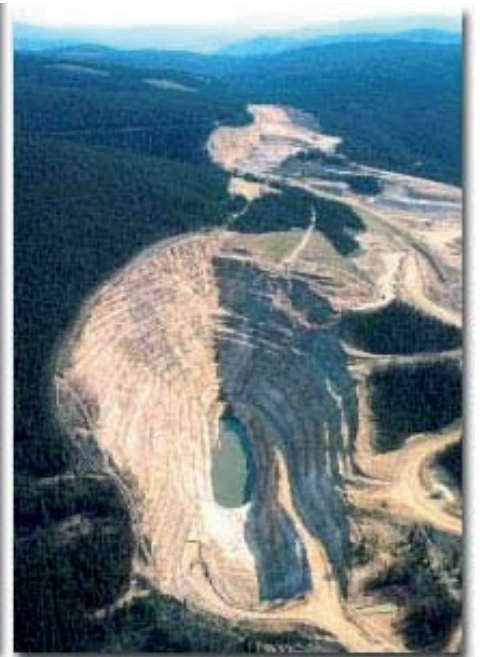
Die Beartrack Goldmine war ein Niedrigkosten-Tagebau mit einem Haufenlaugungsbetrieb