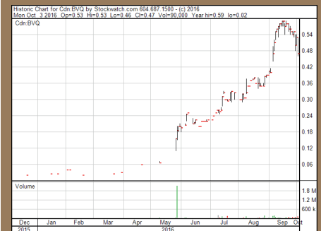
Chart Kanada (TSX.V)