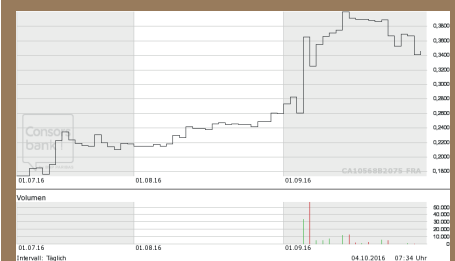
Chart Deutschland (Frankfurt)