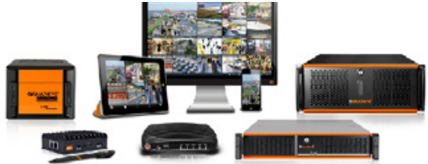
MULTIEYE Produkte für Videoüberwachung