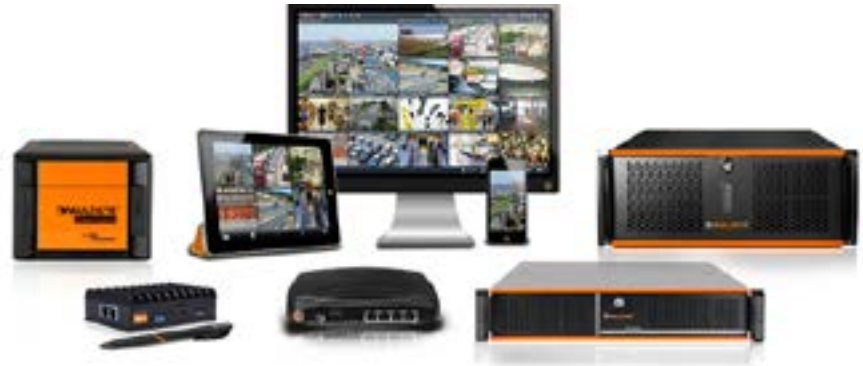
MULTIEYE Produkte für Videoüberwachung